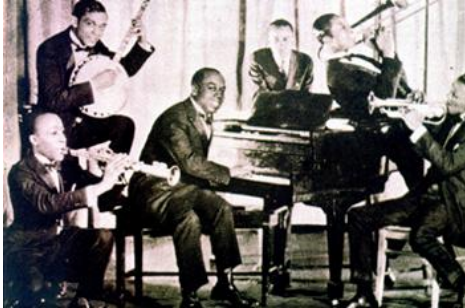
Una banda de jazz.