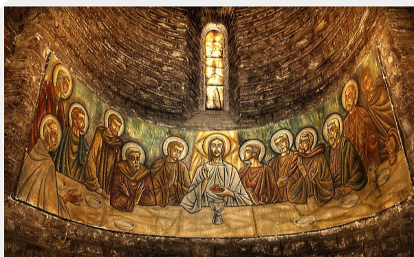
Pintura del Sant Sopar al Monestir de Ripoll