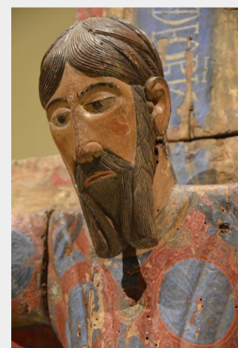
Crist Majestat MNAC

En el dia d'avui es recorda a totes persones que pateixen en la pròpia pell situacions i judicis injustos.